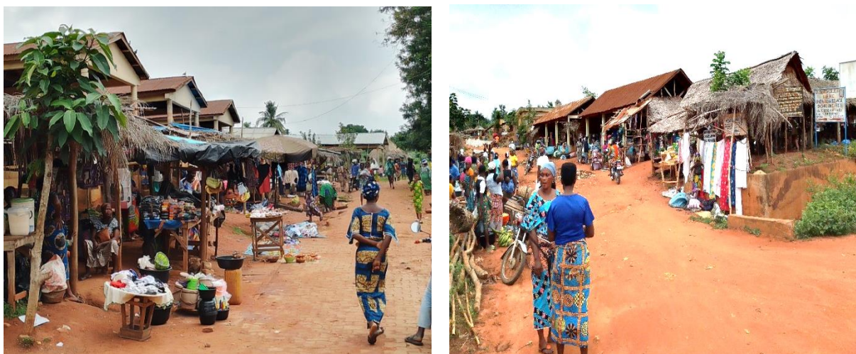
Planche 1 : : Vue partielle des marchés de la commune de Bonou

La planche 1 montre respectivement des vues partielles des marchés de Bonou centre sur l'image gauche et d'Affamè sur l'image droite, situés dans les arrondissements de Bonou et d'Affamè. On peut observer sur les images, des vendeuses de produits manufacturés, des denrées alimentaires et quelques produits agricoles. Un nombre important de vendeuses vendent aux alentours des marchés faute d'insuffisance de places dans les hangars, dû à la concentration des vendeuses des quatre marchés de la Commune dans les deux marchés fonctionnels selon les propos de Dame H. Pauline revendeuse « je vendais des condiments sous un hangar dans le marché d'Assrossa, mais après sa fermeture, je fréquente le marché de nuit du village et le marché d'Affamè les jours d'animation ».